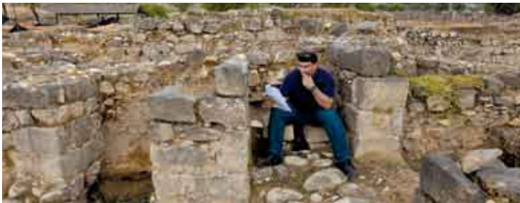
מתקן שירותים סמוך לרחוב מן התקופה המוסלמית הקדומה

מצפון למכלול בית המרחץ, בשטח הפתוח הנפרש לפנינו לכיוון מערב, ניתן להבחין בעשרות בסיסי אבן, הערוכים בשורות ארוכות מקבילות לאורך קירות מסד ('סטילובטים') איתנים. ללא ספק, עמד כאן בעבר מבנה עמודים גדול, שממנו שרדו רק יסודותיו; יזר הרשפלד סבר שלפנינו שרידי השוק העירוני שהיה מקורה בתקרה שנתמכה בעמודים רבים, ובמרכזו – מעבר בכיוון צפון-דרום, תקרת קשתות שנישאו על אומנות רבועות. אך לאחרונה, בעקבות השוואה שעשתה קטיה ציטרין־סילברמן מהאוניברסיטה העברית בין תכנית העמודים של מבנה זה לבין תכנית המסגד הגדול האומי בדמשק, היא הציעה לחזור להצעה שהציע זה מכבר גדעון פרסטר, שמבנה עמודים זה הוא לא אחר מאשר המסגד הגדול בטבריה המכונה במקורות המוסלמיים 'מסגד יום השישי'.