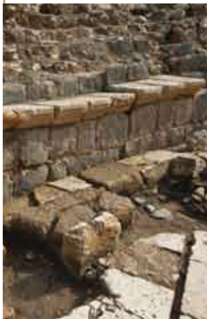
מושבי אבן בתאטרון

השאלה המתבקשת היא מה למוסד רומי חילוני כמו התאטרון בטבריה היהודית, הבירה הרוחנית של עם ישראל בארץ ישראל? אילו מופעים או הצגות התקיימו בו? יש להדגיש, כי במקורות היהודיים התלמודיים אין זכר לתאטרון בטבריה (אם כי מוזכר ה'אצטדין'). יתירה מכך, ידוע, שיחסם של חז"ל למופעי התאטרון היה שלילי ביותר והם השתדלו בכל כוחם למנוע מהאוכלוסייה היהודית לבקר בהם. על יחס זה אנו למדים בין היתר ממאמר חז"ל: 'אומות העולם... אוכלים ושותים ופוחזים ונכנסים לבתי תיאטראות ולבתי קירקסאות, ומכעיסים אותך... אבל ישראל... נכנסים לבתי כנסיות ולבתי מדרשות ומרבין בתפילות' (פסיקתא דרב כהנא כח, א). יש להבהיר שהצגות התאטרון בעולם הרומי לא כללו עוד את הקומדיה, הטרגדיה והסאטירה הקלאסיות; את מקומן תפסו הצגות בעלות אופי עליז וקל יותר, כגון המימוס (המימיקה, המראה מצבי חיים יום־יומיים על הצד המשעשע והמביך שבהם), הפנטומימה והפארסה מעוררי הצחוק, שהיו לעתים קרובות בוטות וגסות – ועל כך, בין השאר, יצא קצפם של חז"ל. האם קיומו של תאטרון רומי בלב העיר היהודית ה'אורתודוקסית' של טבריה מצביע על כך שחלק מהאוכלוסייה היהודית נמשך למנעמי העולם הרומי, בניגוד לדעת הרבנים? או שמא בתאטרון זה הוצגו הצגות 'כשרות למהדרין' – ואולי אף ניתנו שעורי תורה ברבים – כפי שמוכר גם בימינו כאשר אלפי חרדים מתכנסים באצטדיון ביד אליהו על מנת לשמוע את דבר רבני הדור?! הנה חידה נוספת שפתרונה מחכה לגילויים נוספים.