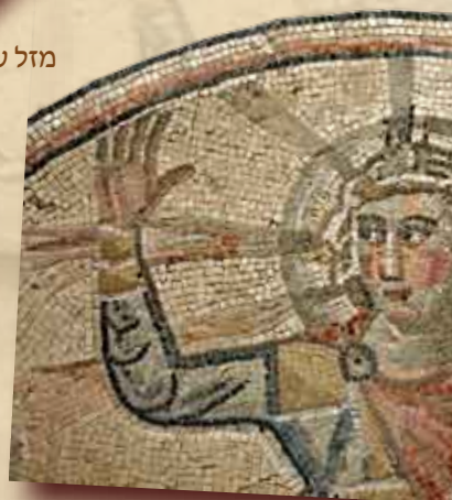
הליוס - אל השמש, אוחז בכדור העולם