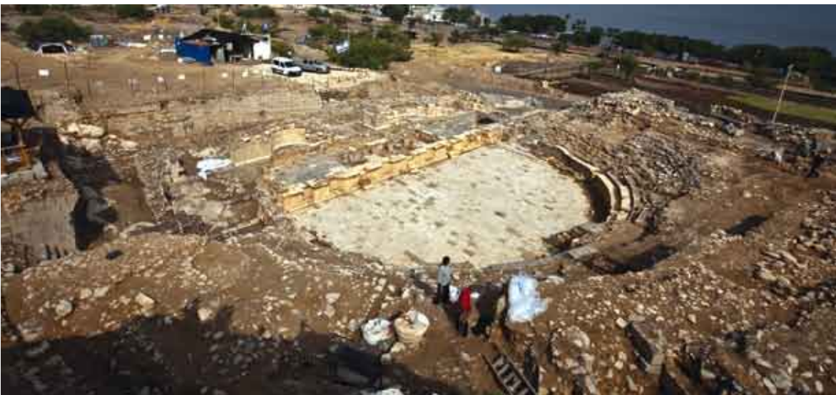
התאטרון הרומי של טבריה

גדול יותר מזה של קיסריה וקרוב לגודלו של התאטרון בבית שאן (שהכיל כחמשת אלפים איש). כיוון מושבי הקהל (ה־cavea) הוא כלפי הבמה, לכיוון צפון, כך שהשמש בגבם של הצופים – כמו בתאטרון של בית שאן. התאטרון נבנה במיקום מרשים: בין הקרדו ממזרח, לבין צלע הר ברניקי במערב, והוא צופה על מרכז העיר ועל הכנרת.