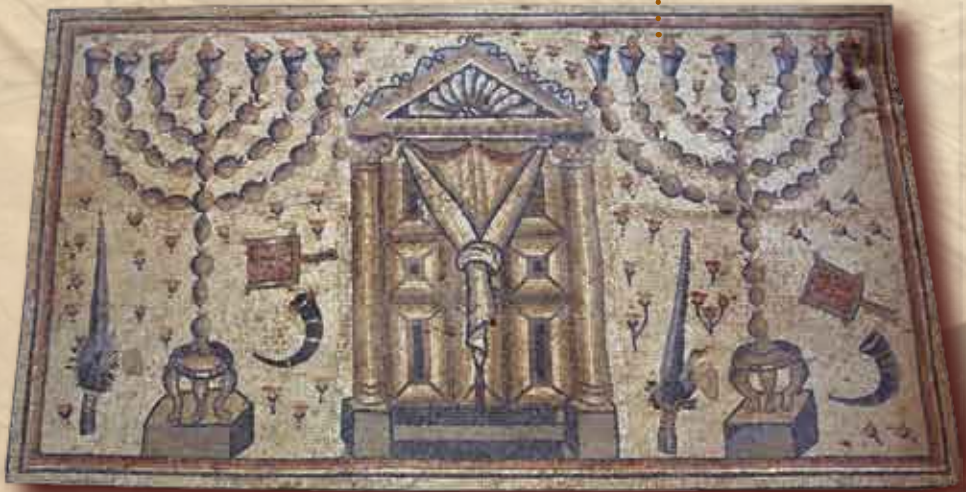
ארון קודש, מנורות, לולבים, אתרוגים ומחתות קטורת