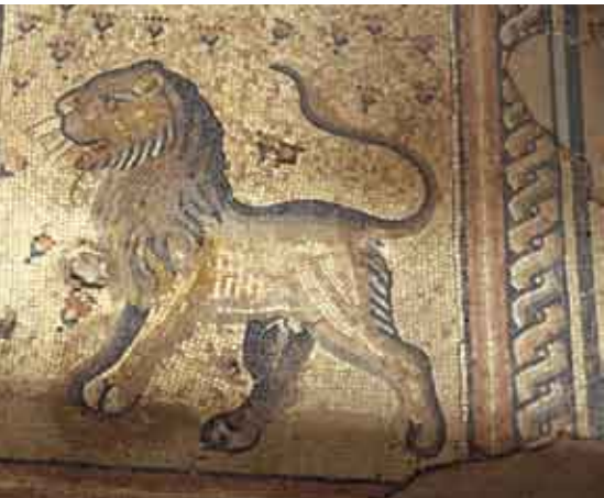
קטע מפסיפס הרצפה של בית הכנסת של חמת

בפסיפסים נזכרים פעמיים סוורוס ויולוס שהיו דמויות ידועות בקהילה. הם אינם חכמים הנזכרים במקורות התלמודיים ותפקידם וזהותם המדויקת אינם ידועים. דבר קיומם נודע רק הודות לתגלית הארכאולוגית. יש הסוברים שאלה היו פקידים חשובים בחצר הנשיא, ויש הטוענים שהם היו מומחים לאסטרונומיה ('ירחנאים') שמילאו תפקיד חשוב בקביעת הלוח היהודי האסטרונומי ופרסומו שהתרחש סביב אמצע המאה הרביעית לסה"נ בתקופת הנשיא הלל השני בטבריה.