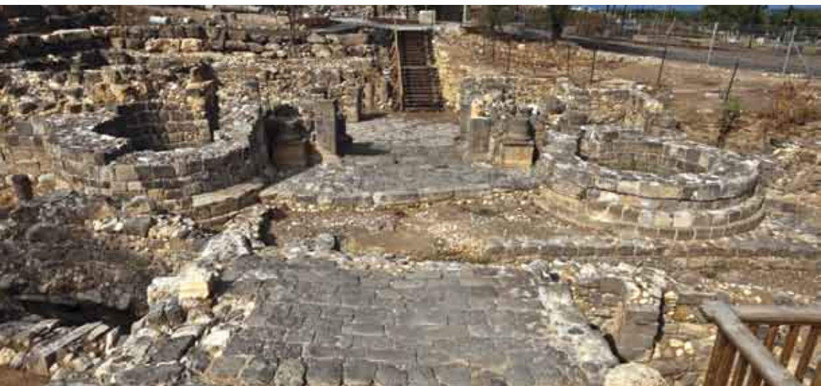
בית השער הרומי

השער, החבוק על ידי שני מגדלים עגולים שנבנו משני צדי פתחו, עמד בעת הקמתו בודד ולא שולב בתוך חומה; החומה שנחשפה ממזרח וממערב לשער היא חומה ביזנטית, המתוארכת למאה השישית, כלומר כחמש מאות שנה לאחר הקמת השער עצמו! שער זה, שנזכר בתלמוד מספר פעמים בשם 'פילי דטבריה', סימל את גבולה הדרומי של העיר במשך מאות בשנים, וממנו מתחיל תוואי הקרדו צפונה. בשער זה ישבו ועסקו חכמי טבריה כמו רבי יוחנן, ריש לקיש ורבי ינאי בדברי תורה, ובמקום זה, על פי התלמוד, עברו ארונות של מתים שהועלו מחוץ לארץ לטבריה על מנת להיקבר