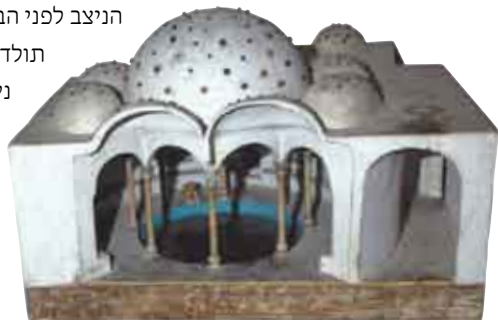
דגם של בית המרחץ בחמת טבריה