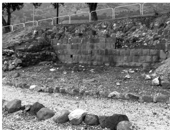
איור 3. הפן החיצוני של החומה העתיקה בחוף הכנרת, מדרום לחומה הביזנטית – מבט לדרום-מערב, 2010.

דומה שנחשף כאן "סוד כמוס". דייגי טבריה ומדריכי התיירים עדיין סבורים שהבאר נמצאת בלב ים (כפי שסברו תושבי טבריה בימי התלמוד) – ויהודים תמימים רבים מושטים בספינות למקומות שונים בכנרת שם מראים להם את מקום הבאר שנגנזה... אבל ר' יצחק לוריא – מקור הסמכות החשוב ביותר בקביעת המקומות הקדושים בגליל – קבע אחרת – שהיא נמצאת ממש סמוך לחוף, "בין העמודים" שעל החוף. זאת ועוד: לאחר שר' חיים ויטאל שתה מן המים הוא החל "להשיג" את חכמת רבו האר"י ושימש מקור והשראה לתורת האר"י לדורות רבים (החסידות, למשל, ולהבדיל השבתאות, התפתחו מתוך תורת האר"י). יש לקוות שמדינת ישראל תשכיל לשמור על המקום מפני שינויים העלולים לפגוע בו. נראה שהדרך הטובה ביותר לשמור את האתר היא