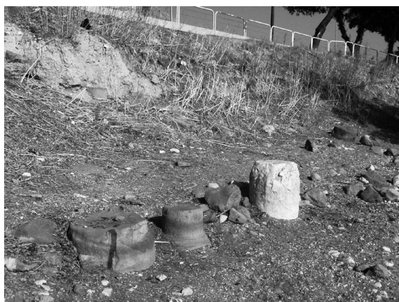
איור 6. עמודים בחוף - מבט לצפון, 2006.