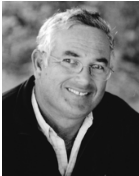
יזהר הירשפלד (1950-2006)