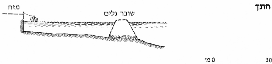
איור 4. שרידים ארכאולוגיים בחופה של טבריה - תכנית (מתוך הירשפלד 1991: 22; באדיבות רשות העתיקות).