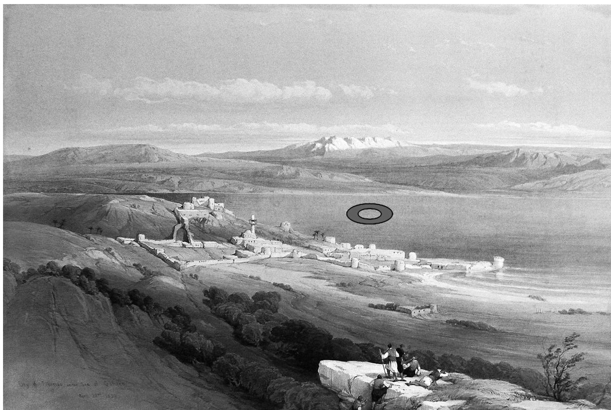
איור 1. ציור של ד' רוברטס משנת 1839, עם סימון של באר מרים בלב הכנרת, מעשה ידי המחבר.

המסורת על "באר מרים שנגנזה בכנרת" (איור 1) מוזכרת כבר במקורות התלמודיים הדורשים את הפסוקים "או ישיר ישראל את השירה הזאת, עלי באר ענו לה. באר חפרוה שרים כרוה נדיבי עם... ונשקפה על פני הישימון" (במדבר כא: טז-כ) 2 , והיא ידועה זה דורות ליהודי ארץ-ישראל ובייחוד ליהודי טבריה. זה שנים שנוהגים מדריכים להוציא קבוצות של יהודים מאמינים בשיט אל לב הכנרת, ועל פי הנחייתם עוצרות הספינות בלב הימה (לעתים במקום של נביעה תתי-ימית או מערבולת), ובמקום עצירתן נאמר להם שכאן – במקום זה ממש – גנזה בארה של מרים. היהודים המאמינים מתפללים במקום, כל אחד שופך את לבו בתפילה תמימה,