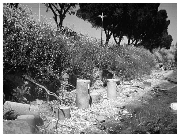
איור 5. עמודים בחוף - מבט לצפון, שנות השמונים של המאה הכ'.

החוף הייחודי הזה, החוף הבלתי נגוע האחרון שנותר בטבריה, כשמורת טבע עירונית ושמורת עתיקות, שיש בה, על פי המסורת, גם סגולות רוחניות.