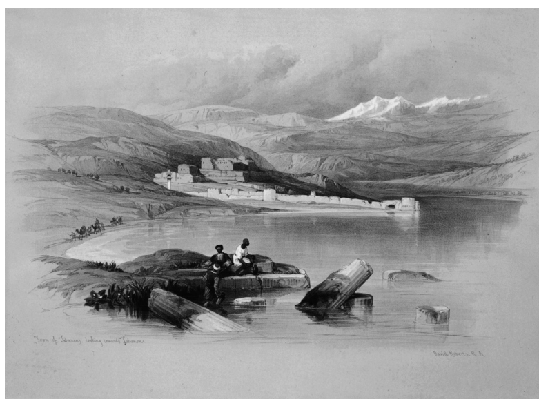
איור 8. עמודים בחוף: ציור של דייוויד רוברטס משנת 1839 – מבט לצפון-מערב.