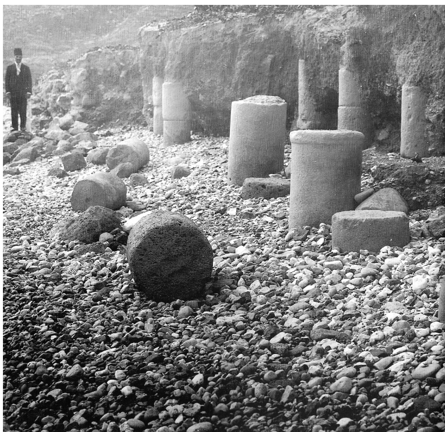
איור 7. עמודים בחוף – מבט לדרום, שנות העשרים של המאה הכ' (מתוך הירשפלד 1991: 24; מקור הצילום: ארכיון המנדט של רשות העתיקות, באדיבות רשות העתיקות).