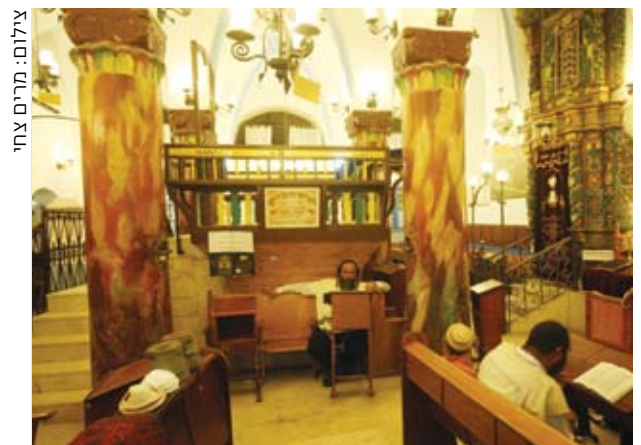
ראשון חסידיים בארץ. בית כנסת האר"י בצפת

בערב שבת פרשת ח'יפה זכור ירד ר' נחמן לעכו, רק כדי לגלות שהספינה המבוקשת כבר מלאה באנשים הבורחים מהסכנה המתקרבת. הרב ומשמשו נאלצו להישאר בשבת בעכו אחוזת הפאניקה, "והיה דוחק גדול בעיר כי היה המקום צר להם להביל ריבוי אוכלוסין כל כך, והיה פחד גדול שם"