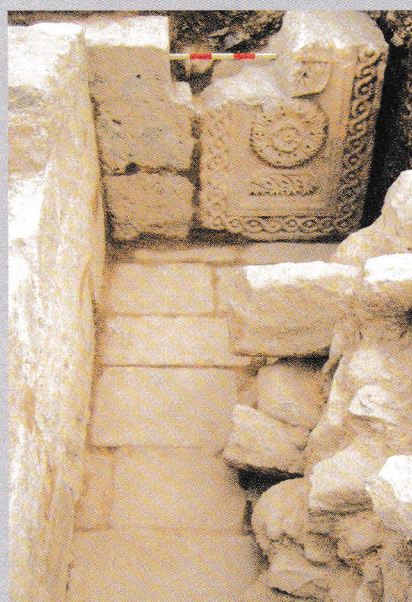
משמאל למעלה: רצפת השער ואבן המזוזה המערבית בזמן גילויין במאי 2003 משמאל למטה: שבר משקוף עם עיטור זר הרקולס