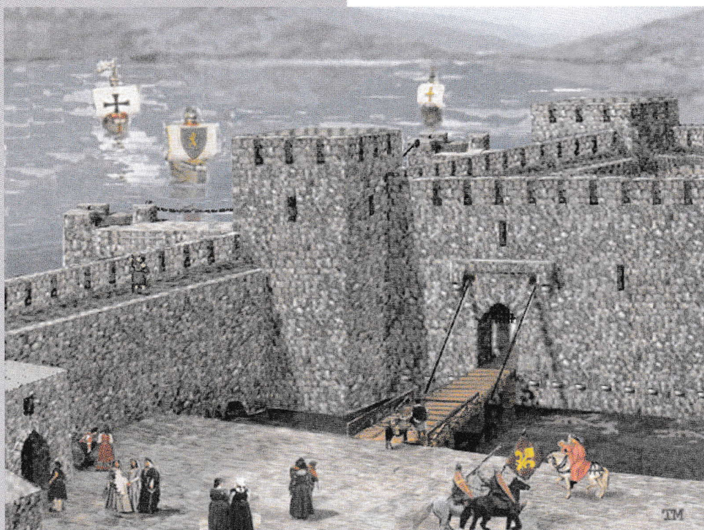
שחזור המבצר: טניה מלצין