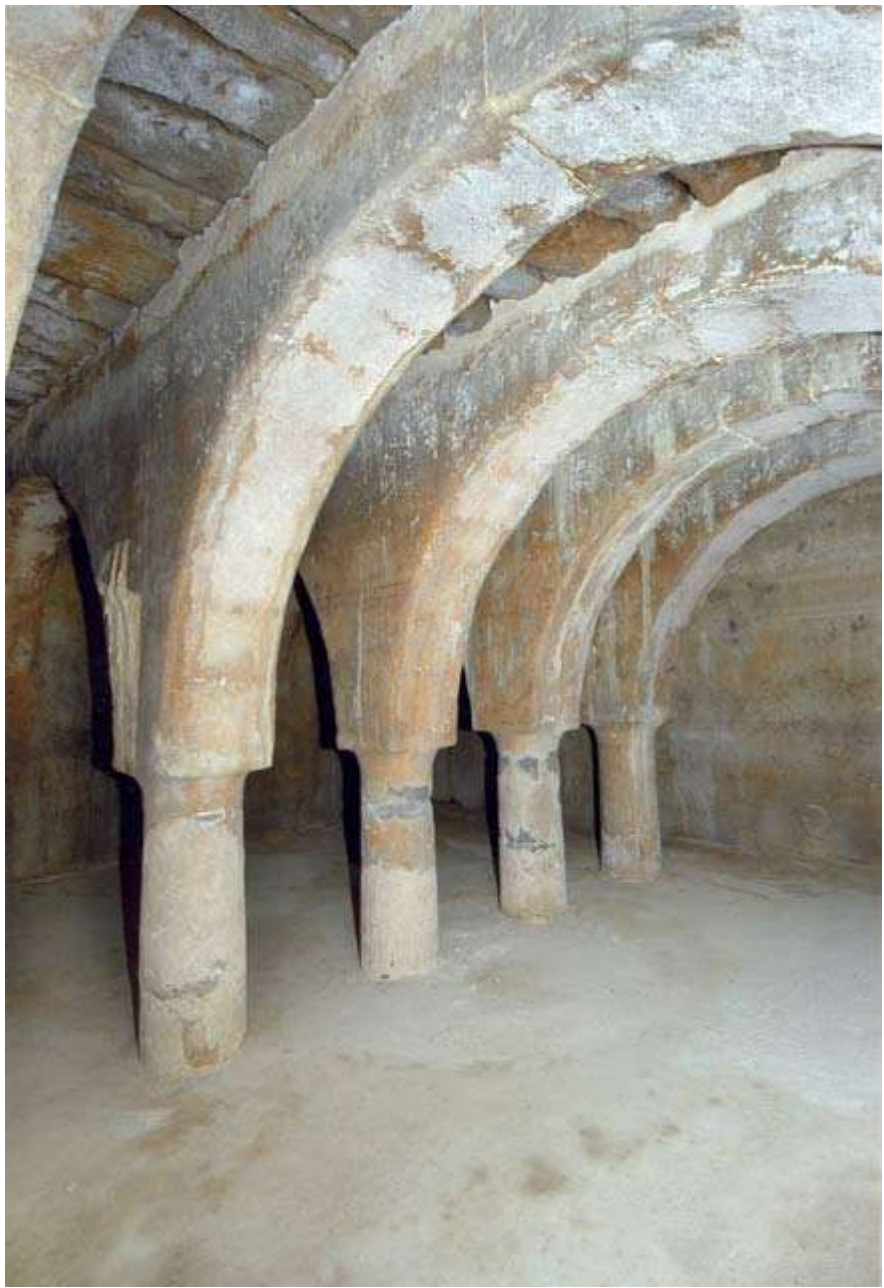
בור המים מתחת לבזיליקה.