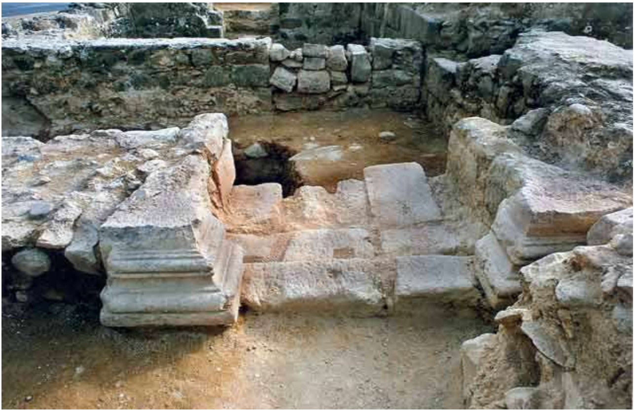
פתח כניסה לאגף המזרחי של הבזיליקה, מבט לדרום.