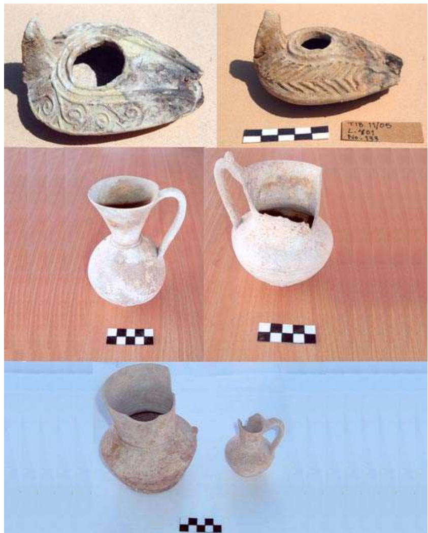
7. נרות וכלים מהתקופה העבאסית.