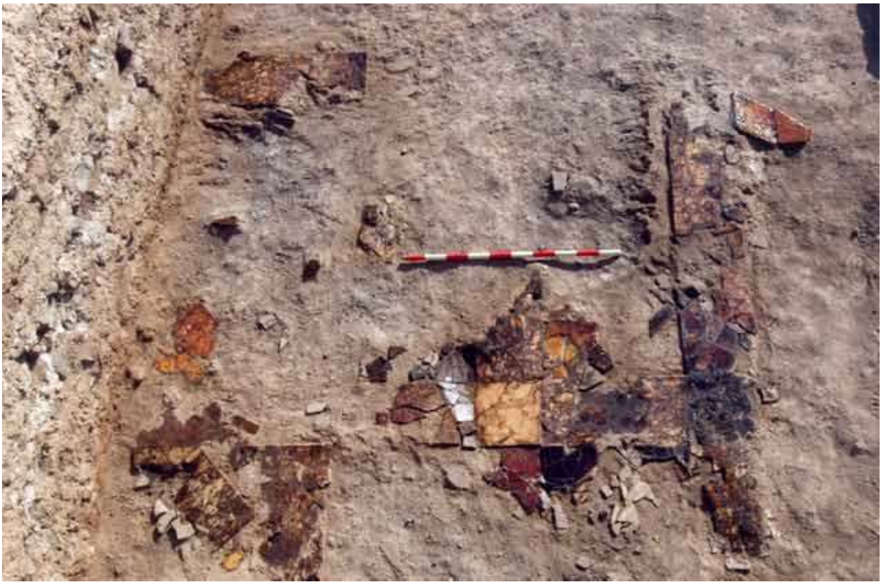
שכבה VII; רצפת אופוס סקטילה.