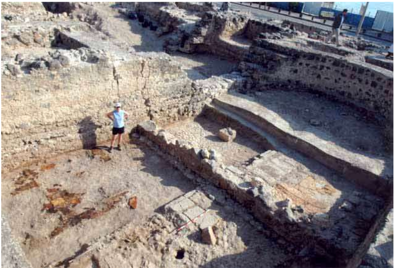
רצפות שיש ושרידי קירות מהתקופה ההרודיאנית, מבט לצפון-מזרח.