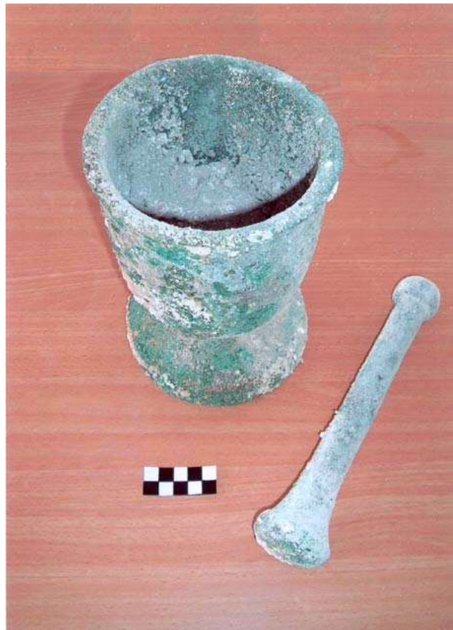
6.מכתש ועלי עשויים ברונזה מחפירות הבזיליקה.