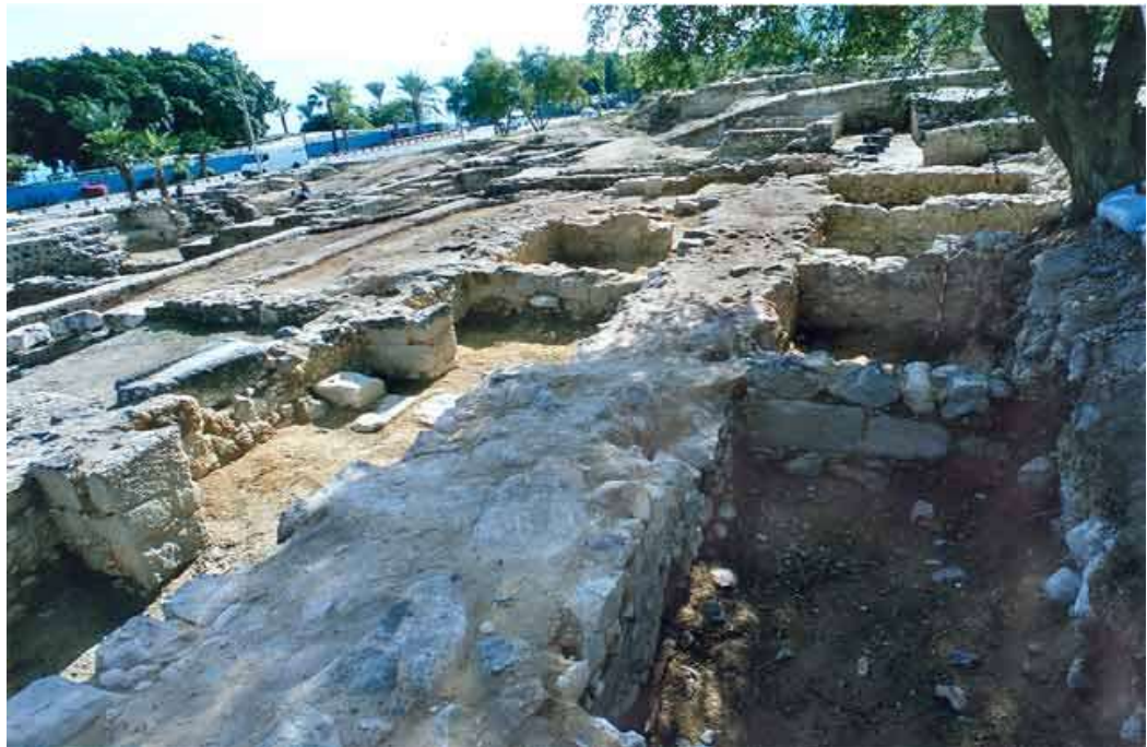
8. מכלול חדרים מהתקופה העבאסית, מבט לדרום-מזרח.